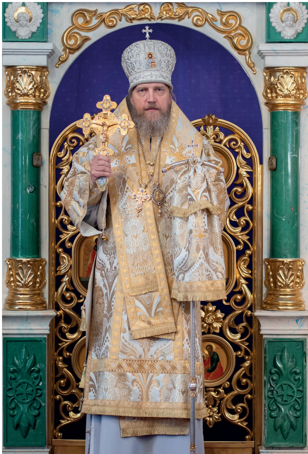
ЕПИСКОП УРЖУМСКИЙ И ОМУТНИНСКИЙ ИОАНН